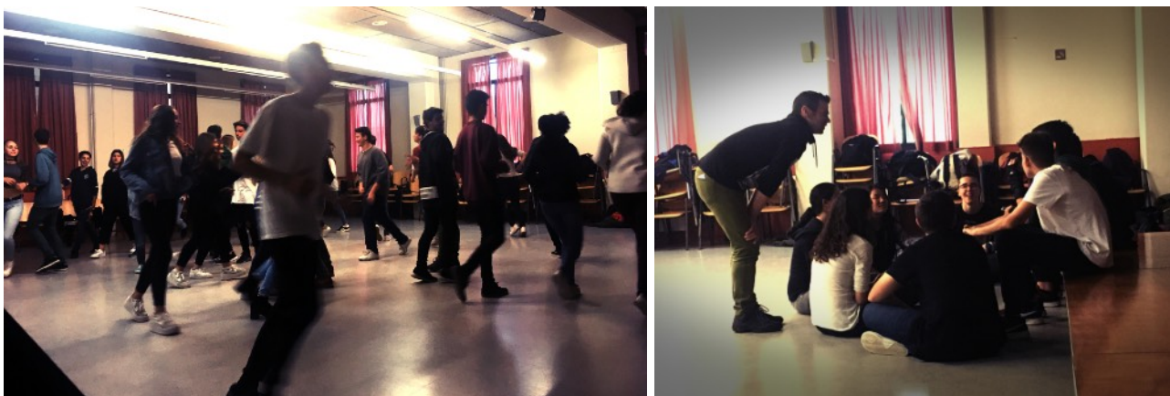
Càpsules pedagògiques al IES Institut Alella - Abril 2017

La durada aproximada de la funció és de 60 minuts. El post funció, aproximadament 1 hora.