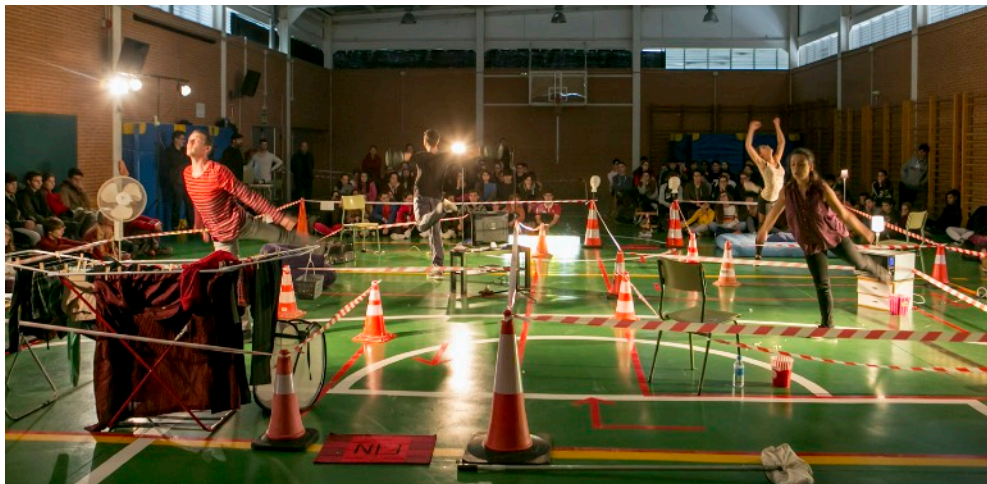
Representació al IES Triana, Sevilla - Novembre 2018

Visualització de l'espectacle sencer 2018 (contrassenya: TTG18FE)